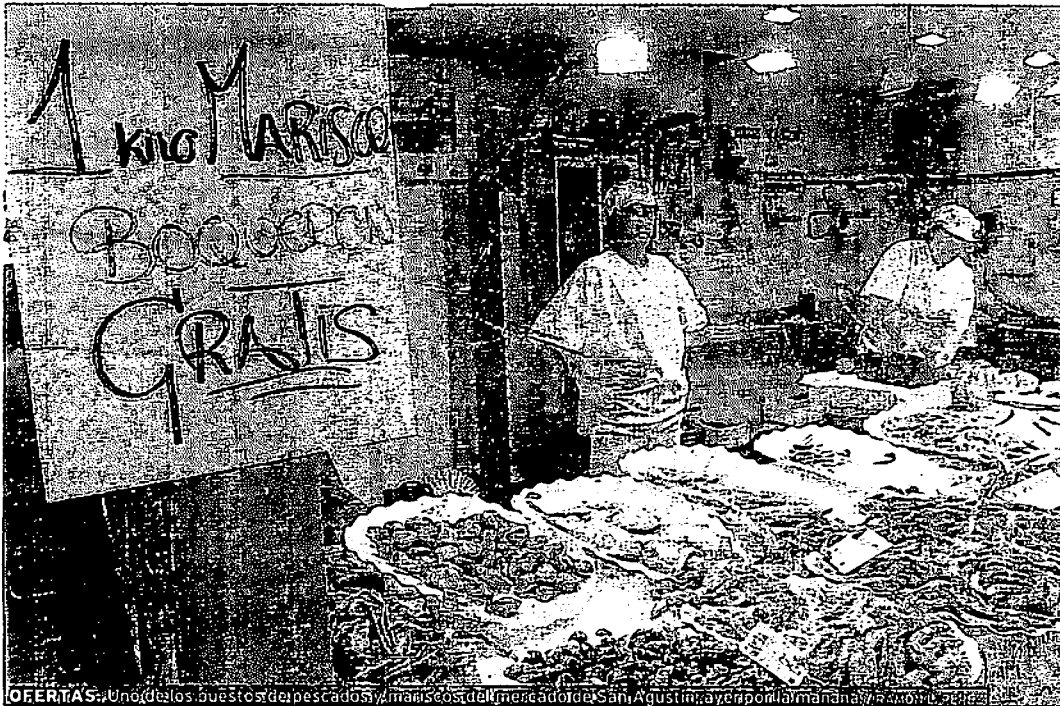
OFERTAS. Uno de los puestos de pescados y mariscos del mercado de San Agustín, ayer por la mañana.